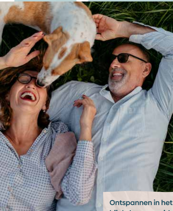
Ontspannen in het gras bij de bomenweide.