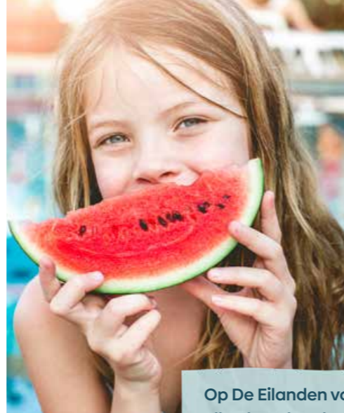
Op De Eilanden voelt elke dag als vakantie.