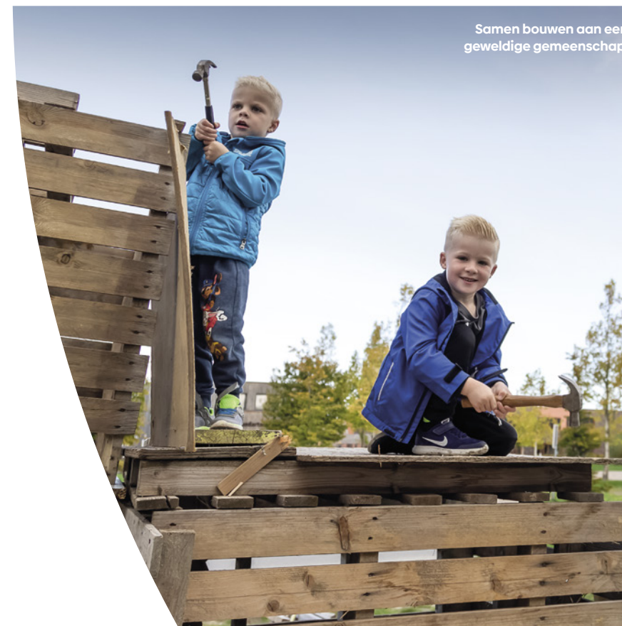
Samen bouwen aan een geweldige gemeenschap.

Je hoeft niet ver te reizen voor essentiële diensten. Enkele woningen worden gebouwd als woonwerk-woning. Hier vestigen zich kleine bedrijven die de buurt van dienst zijn, denk bijvoorbeeld aan een kapper of een fysiotherapeut. Zij dragen bij aan het