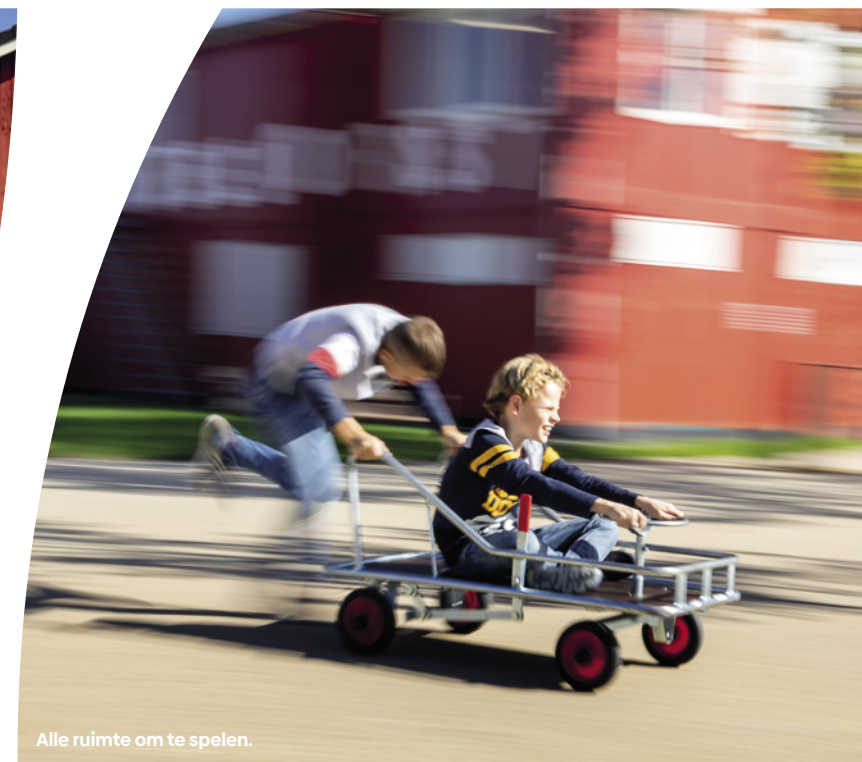
Alle ruimte om te spelen.