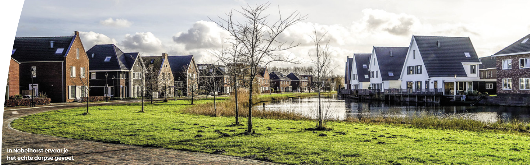
In Nobelhorst ervaar je het echte dorpse gevoel.

Binnen Het Marktdorp liggen 3 buurten, met elk een eigen karakter: Het Dorpshart, De Eilanden en Aan Het Bos. Verspreid over deze 3 buurten worden 60 duurzame woningen gebouwd onder bijzondere – natuurinclusieve – architectuur.