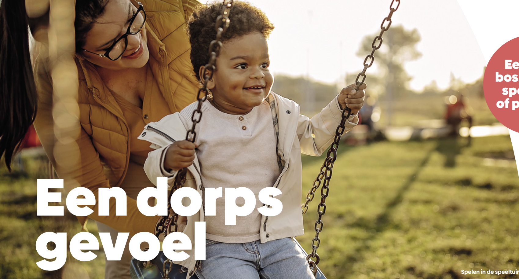
Spelen in de speeltuin.

Het echte dorpsgevoel – elkaar begroeten in het voorbijgaan, een kopje suiker lenen bij de burens, kinderen die spelen op straat – creëer je samen. Het onderlinge vertrouwen groeit, elke keer dat je elkaar spreekt en wanneer je iets samen doet. In Groen Nobelhorst krijg je hier, heel ontspannen, alle gelegenheid toe. Doe mee en maak deel uit van deze prachtige, hechte en unieke gemeenschap.