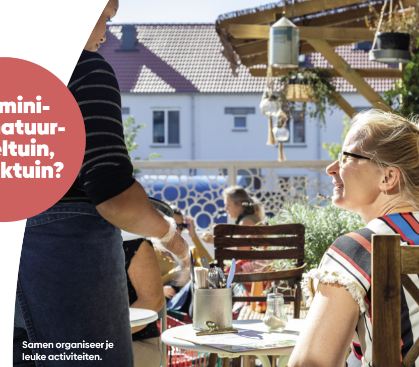
Samen organiseer je leuke activiteiten.

Een mini- bos, natuur- speeltuin, of pluktuin?